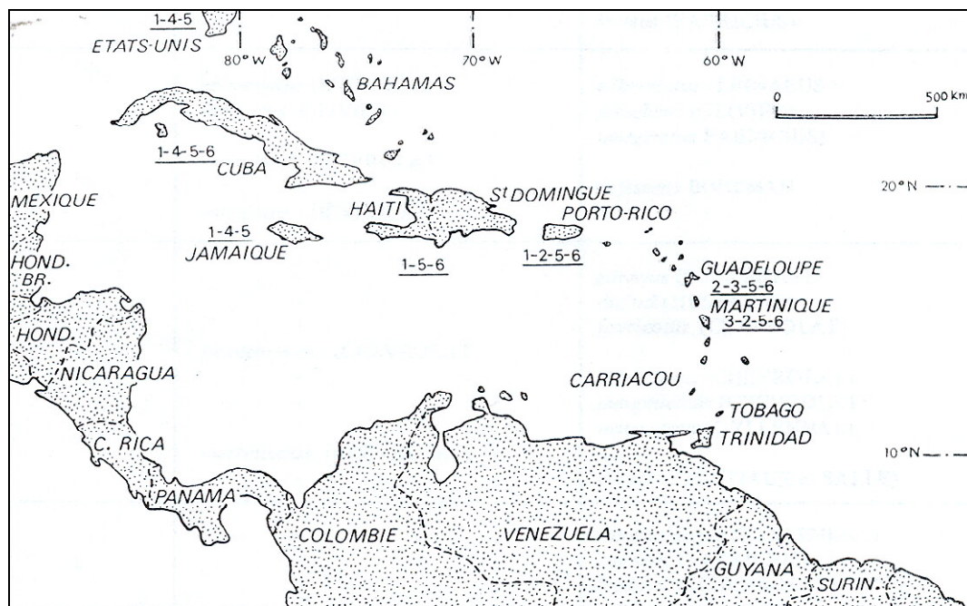
Figure 1 . Distribution des principaux charançons ravageurs de Citrus dans l'arc antillais: 1. Artipus , 2. Compsus , 3. Diaprepes , 4. Lachnopus , 5. Litostylus , 6. Exophtalmus .

Onze genres de charançons sont associés selon WOODRUFF (1985) aux Citrus en Floride et dans l'arc antillais: Artipus , Cleistolophus , Compsus , Diaprepes , Epicaerus , Exophtalmus , Lachnopus , Litostylus , Pachnaeus , Pantomorus et Tanymecus (WOODRUFF. 1985) Seuls 6 genres sont observés dans l'arc antillais (Floride exclue). La distribution de ces ravageurs est illustrée par la figure 1.