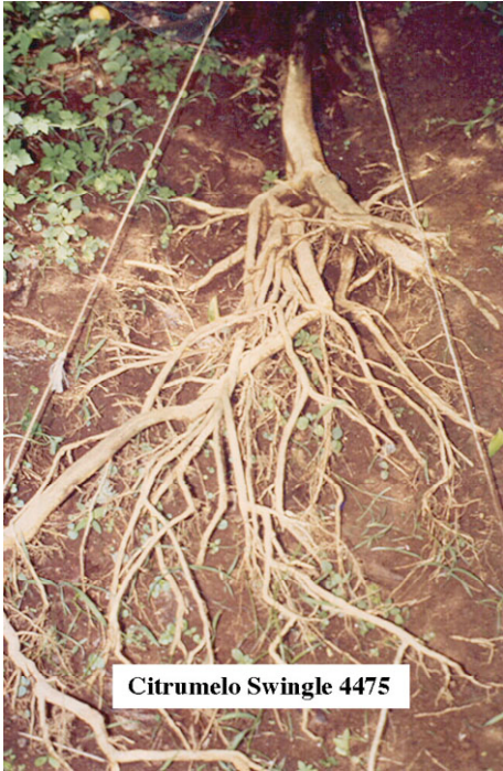
Citrumelo Swingle 4475