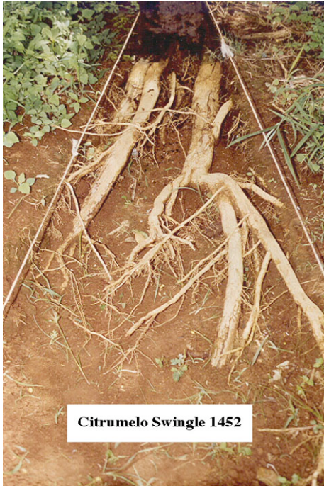
Citrumelo Swingle 1452