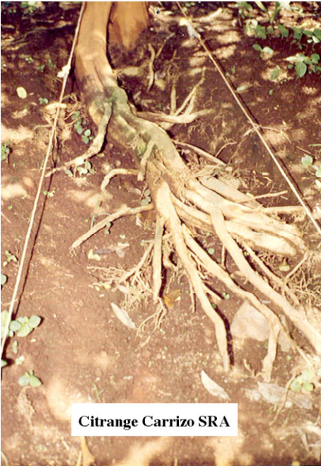
Citrange Carrizo SRA