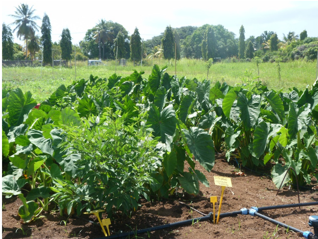
Avec irrigation, et Pois de bois en bordure