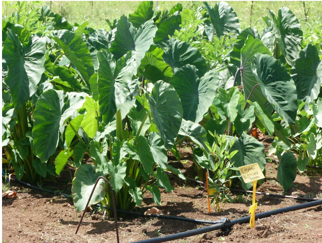
Le dispositif d'évaluation des variétés de Fidji, au champ