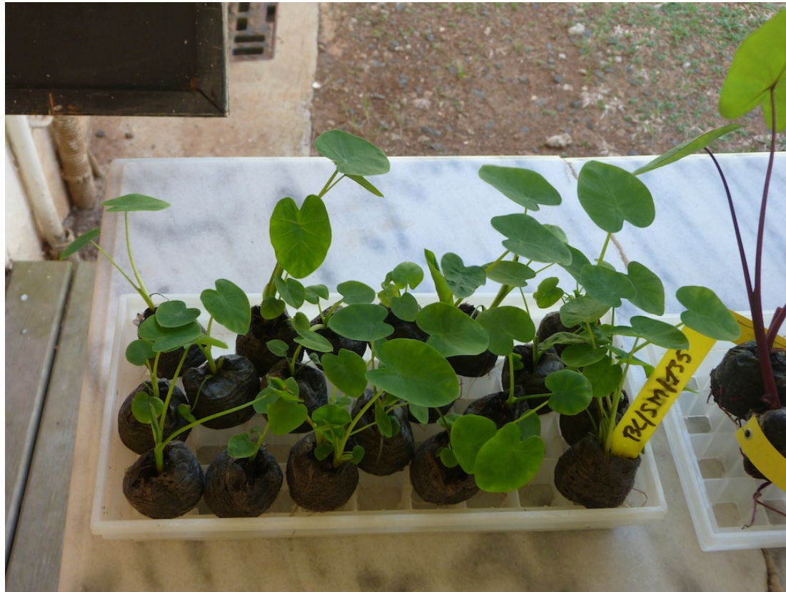
Jeunes plants sevrés