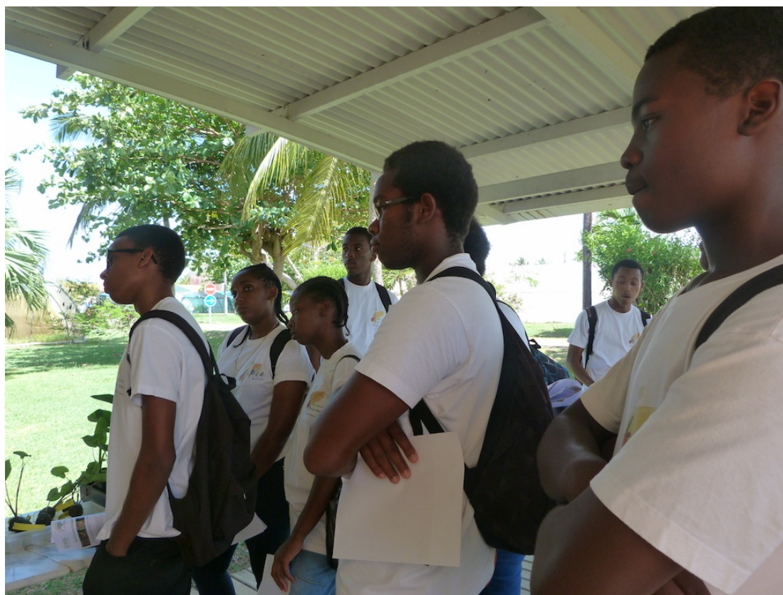
Les élèves du Lycée Agricole de Convenance sont concentrés