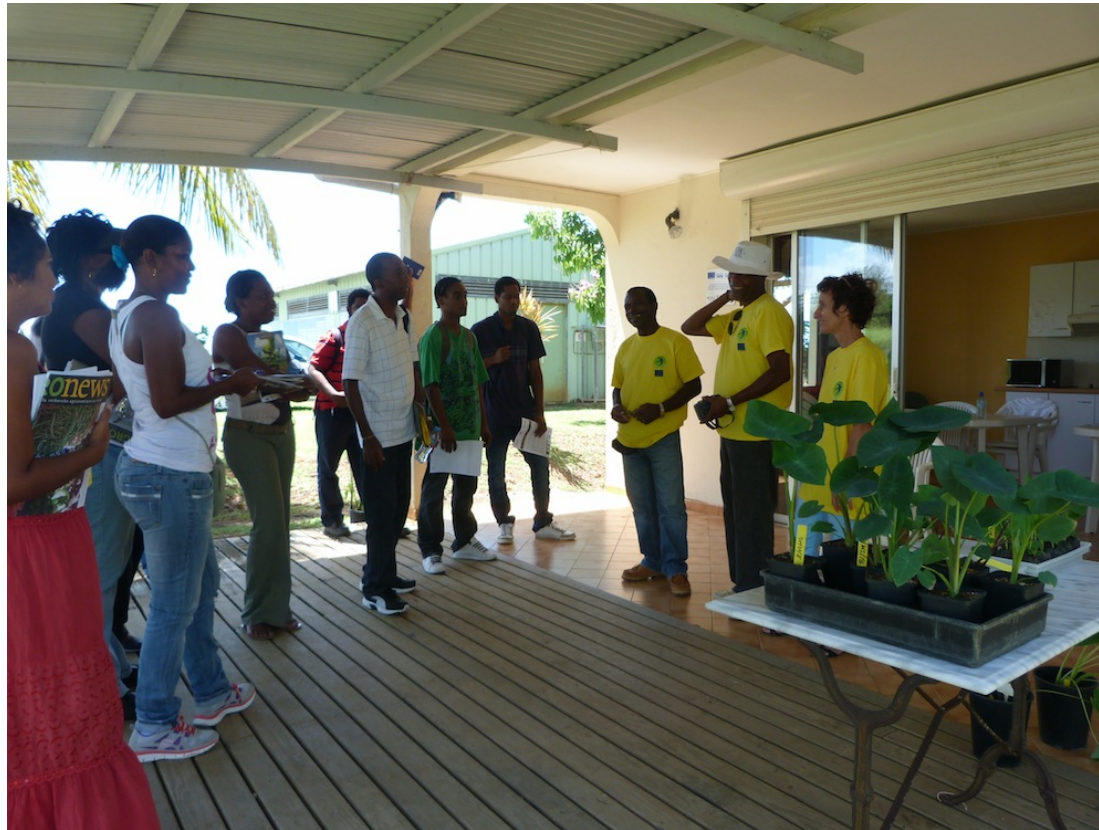
Accueil des élèves sur le stand « Madères »