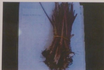
Madère à chair rose