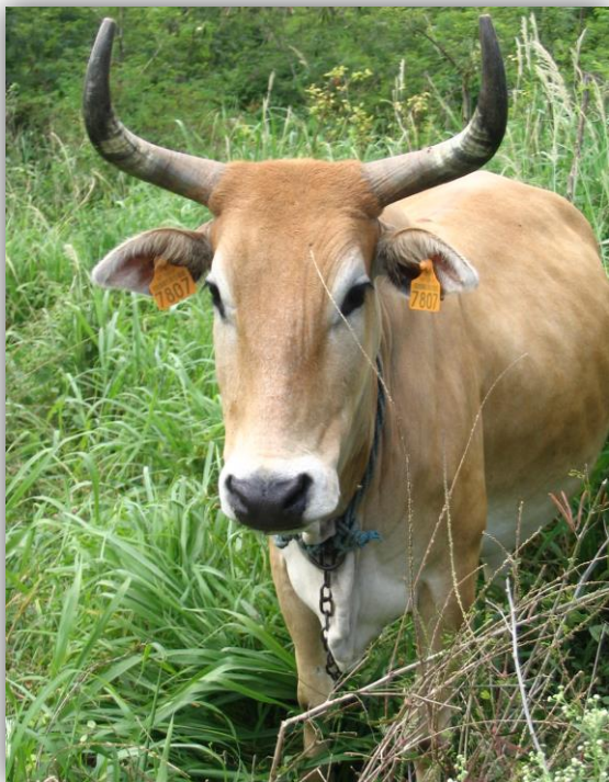
Photographie DAAF SEA 2007