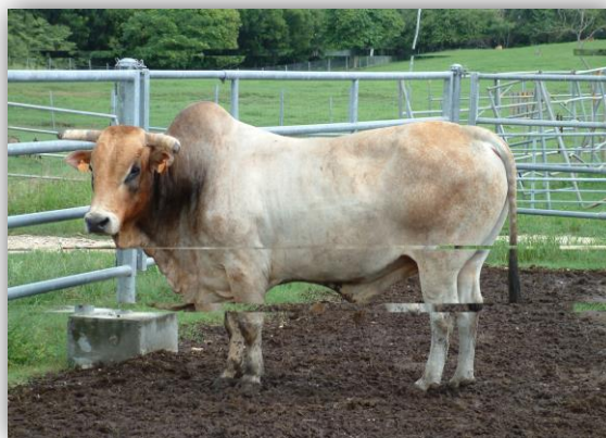
Photographie Sélection Créole : taureau créole